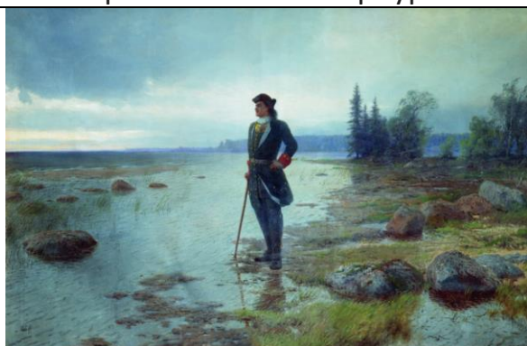
Лев Феликсович Лагорио. На берегу пустынных волн.