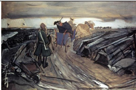
Валентин Серов. Петр I на работах. Строительство Петербурга.

Пётр I был героем множества полотен русских художников