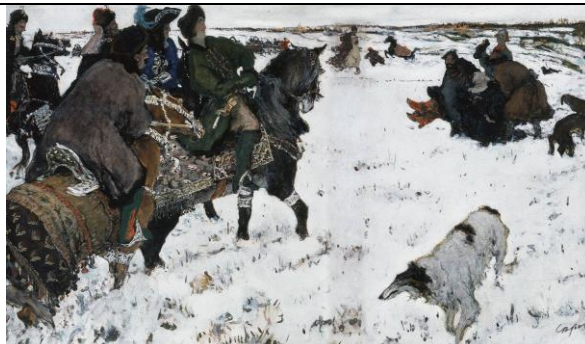
Валентин Серов. Петр I на псовой охоте